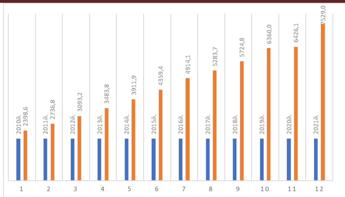
2-rasm. O'zbekiston Respublikasida aholi jon boshiga to'g'ri keladigan xizmatlar hajmi (ming so'm hisobida)