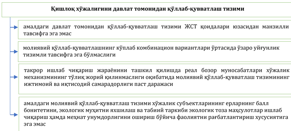
1-расм. Қишлоқ хўжалигини давлат томонидан қўллаб-қувватлаш тизимидаги муаммолар

ушбу муаммолар нафақат тармоқнинг барқарор ривожланиши, балки иқтисодийнинг барқарор ривожланишини таъминлашга ҳам таъсир кўрсатмоқда. Амалга оширган таҳлилларимиз натижасида қишлоқ хўжалигини давлат томонидан қўллаб-қувватлаш тизимидаги мавжуд муаммоларни қуйидаги (1-расм) тарзда тизимлаштириш мумкин.