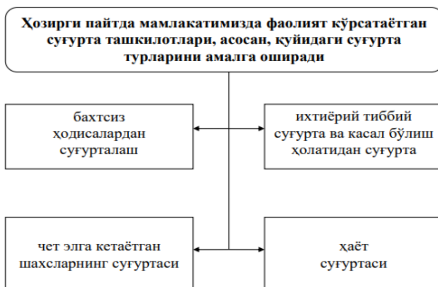
1-расм. Мамлакатимизда суғурта компанияларнинг асосий суғурта турлари[8]

цияларни МДХ давлатлари билан таққослаганда ҳам бизнинг мамлакатимизда кўпроқ имкониятлар яратилган.