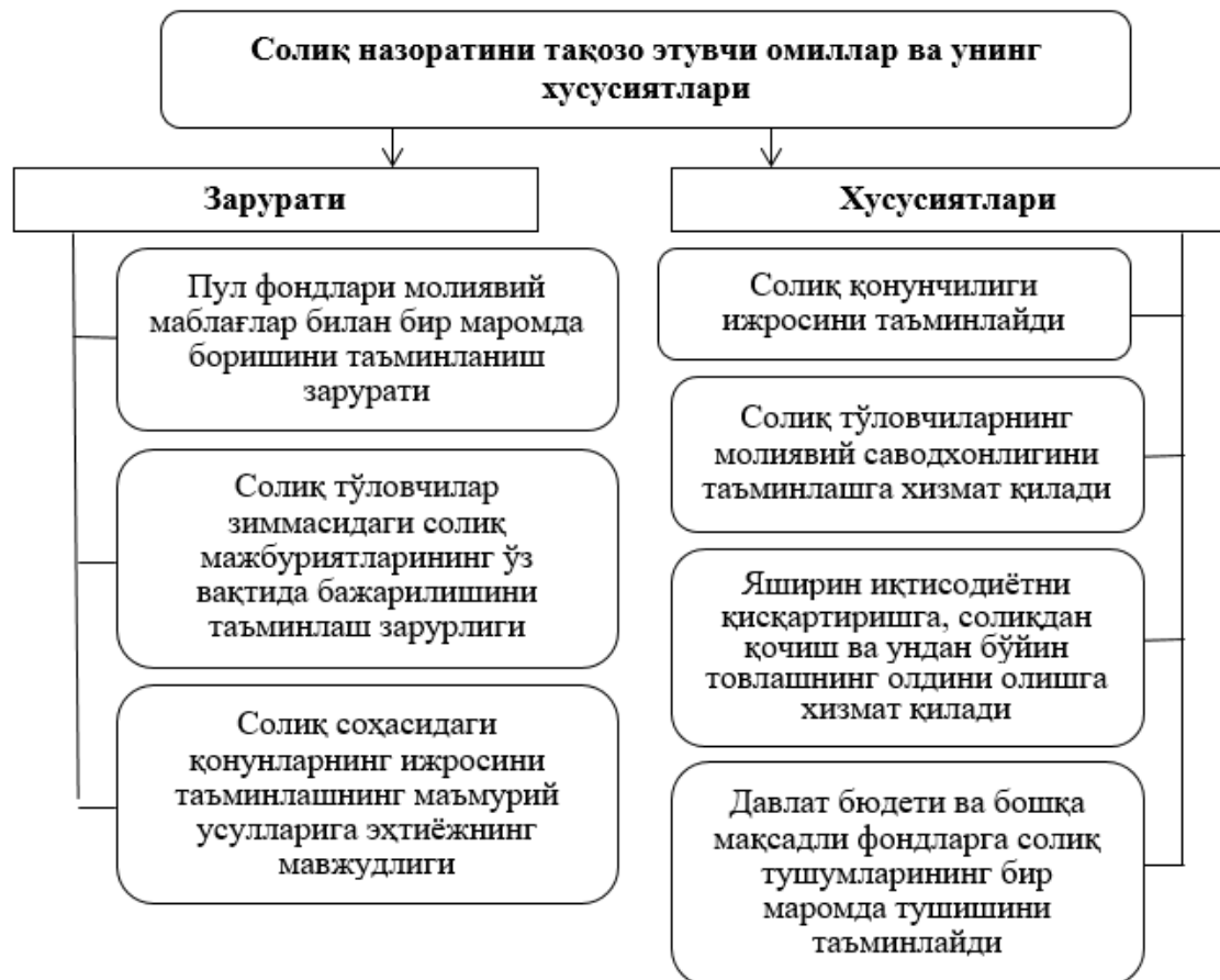
2-расм. Солиқ назоратини тақозо этувчи омиллар ва унинг хусусиятлари

солиқ тўлаш маданиятини ошириш, уларни турли хил молиявий ва бошқа жавобгарликлардан асраш, бозор муносабатлари шароитида солиқ тўловчининг умумий қадрининг (репутацияси) сақланишига хизмат қилишдан иборат бўлади.