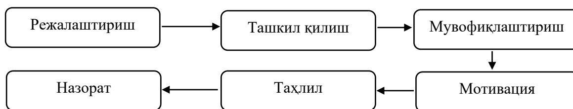
1-расм. Анъанавий бошқарув функцияларининг замонавий кўриниши

Мавзуга оид адабиётлар таҳлили. Шунингдек, олимлар бошқаришни олдиндан кўриш, тартибга солиш, мувофиқлаштириш, тасарруф этиш ва назорат қилиш, деб айтиб ўтган[1].