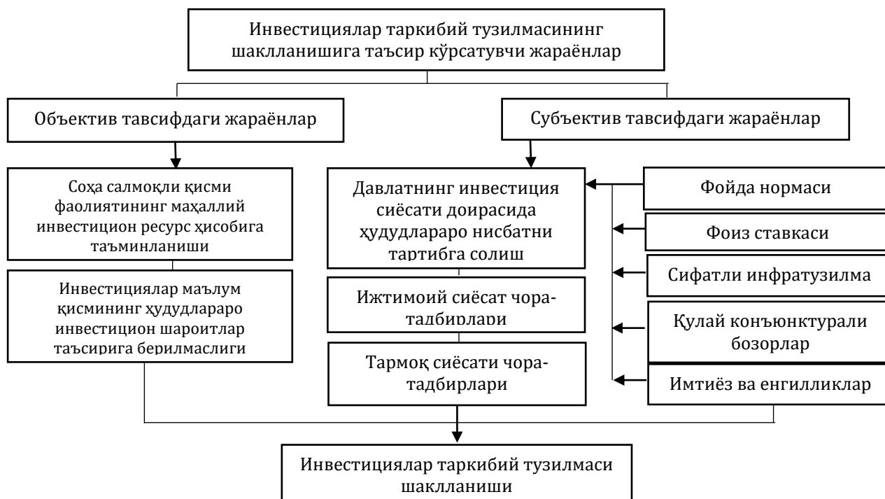
2-расм. Кичик бизнес секторига жалб этилган инвестициялар таркибининг такомиллашуви жараёнлари схемаси[8]