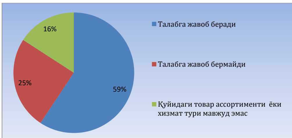
2-диаграмма. Самарқанд шаҳридаги озиқ-овқат маҳсулотлари савдо дўконларининг мониторингдан кейинги ҳолати таҳлили, %ларда (56 та дўкон мисолида)

ти талабга жавоб бермайди, 16 % дўконларда саволномада кўрсатилган товар асортименти ёки хизмат тури мавжуд эмас.