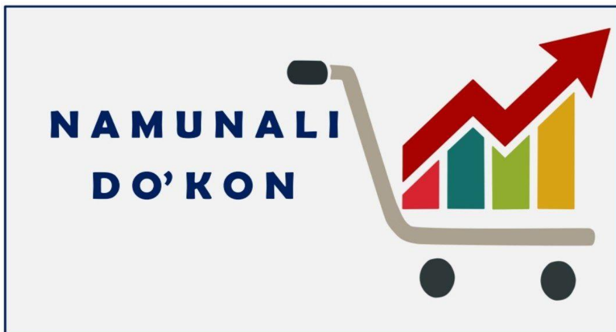
1-расм. “Намунали савдо дўкони” логотипи

Изоҳ: “90-100” балл тўплаган савдо дўкони намунали савдо дўкони ҳисобланади.