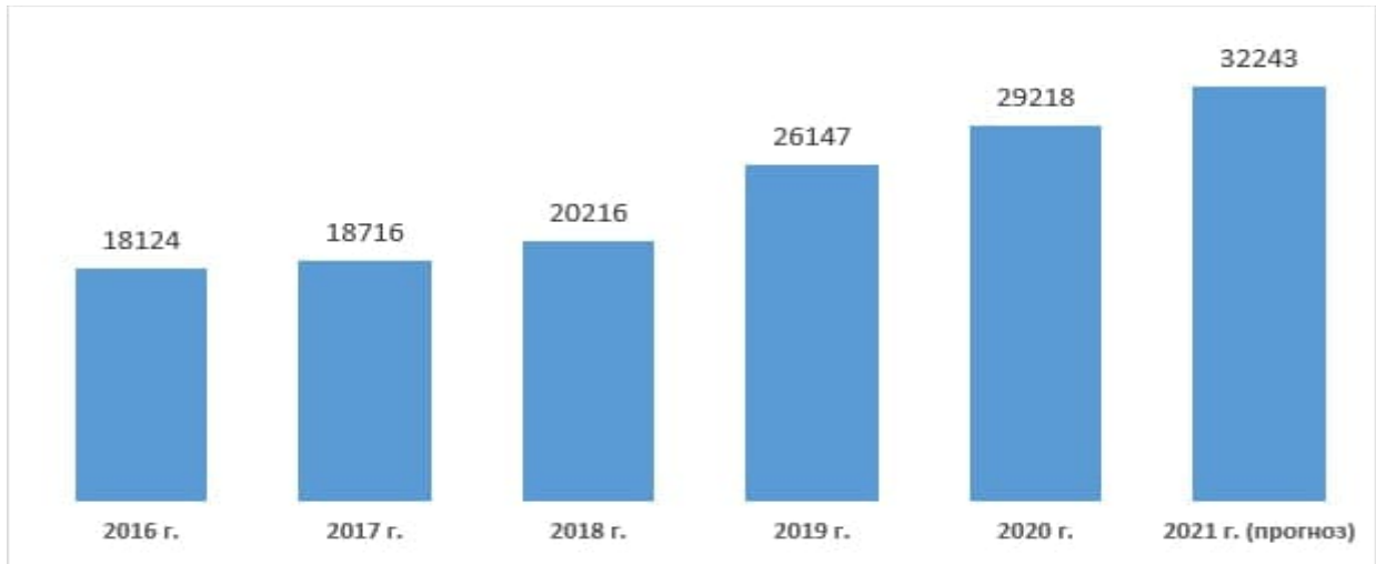
Rasm. 2016-2021- yillarda mehmonxona nomerlar fondining oshib borishi[12]

dan koʻproqqa oshdi. 2016-2020 yillarda Oʻzbekistondagi umumiy nomerlar fondi 18,1 mingtadan 29,2 mingtaga oshdi, umumiy oʻsish koʻrsatkichi esa 11 ming nomerga, yaʼni 1,6 baravar oshdi. Oʻsishning oʻrtacha surati yiliga 10-11 foizni tashkil qildi. Oʻtgan yillardagi oʻsish suratlaridan kelib chiqib, 2021 yilda nomerlar fondining oʻsishi 32 243 taga yetishi kutilmoqda[11].