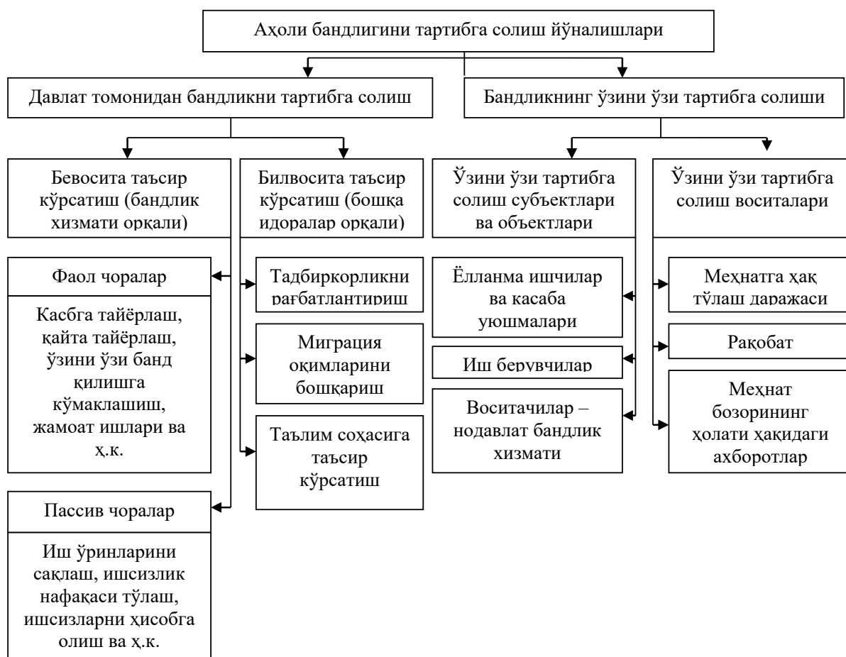
2-расм. Аҳоли бандлигини тартибга солиш йўналишлари

Бозор иқтисодиёти ривожланган мамлакатлар тажрибаси кўрсатишича, давлат томонидан меҳнат бозорини тартибга солиш ва ўзини ўзи тартибга солиш механизмларини уйғунлаштириш аҳоли бандлигини тартибга солишнинг самарали усули бўлиб қолди. Бандликни тартибга солишнинг асосий йўналишлари 2-расмда тўлиқ келтирилган.