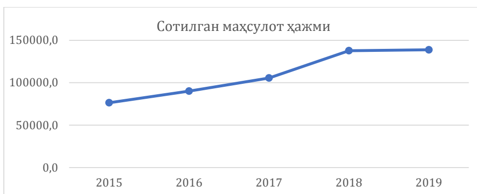
1-расм. “Андижон био кимё заводи” АЖнинг иқтисодий кўрсаткичлари ўзгариши

Андижон шаҳрида жойлашган “Андижон био кимё заводи” АЖ фаолиятида ҳам иқтисодий натижалар бир мунча ўзгарган бўлиб, корхона томонидан реализация қилинган маҳсулот ҳажми йилдан йилга ортиб борган яъни 2019 йили сотилган маҳсулот ҳажми 2018 йилга нисбатан 1 фоизга ортган бўлса, 2017 йилга нисбатан 31 фоизга, 2016 йилга нисбатан 54 фоизга ортганлигини кўришимиз мумкин (1-расм).