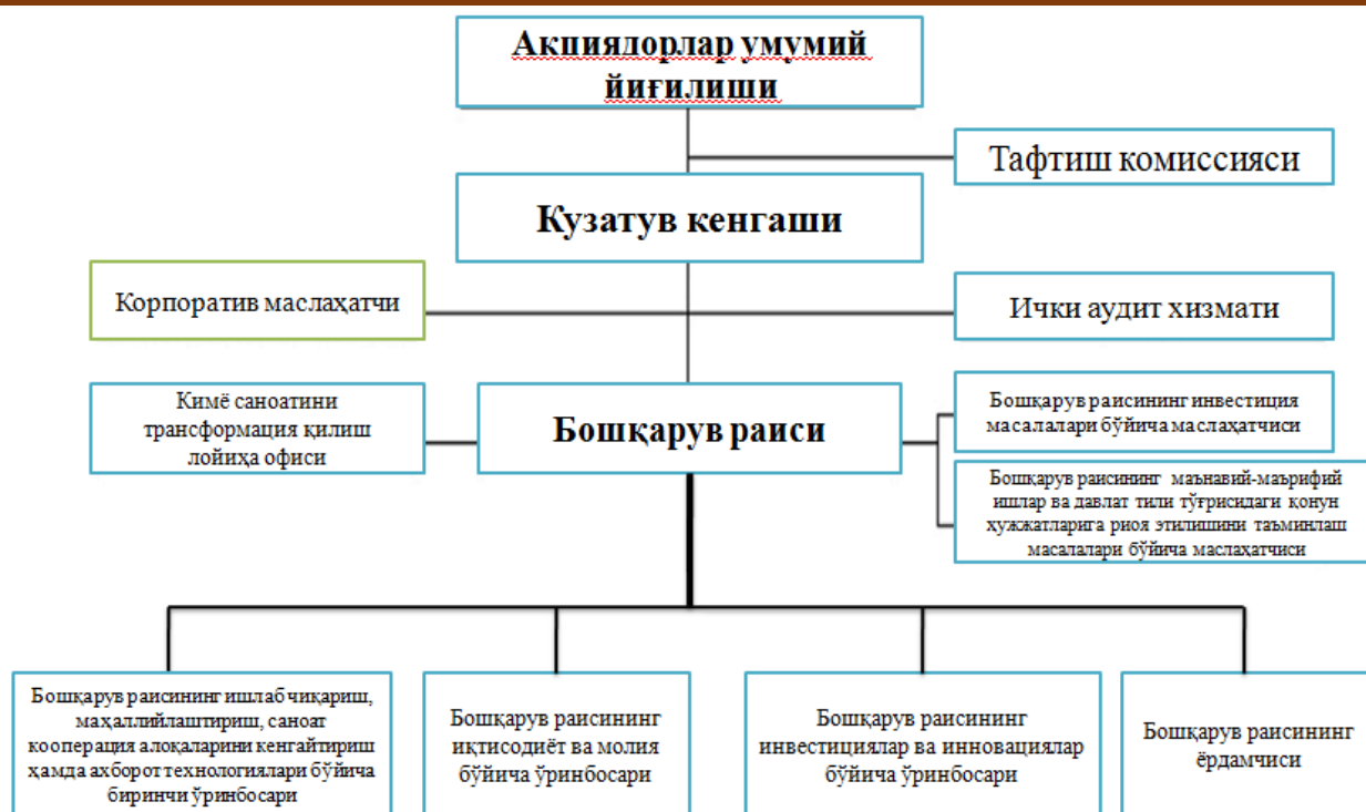
1-расм. «Ўзкимёсаноат» АЖ ташкилий тузилмаси