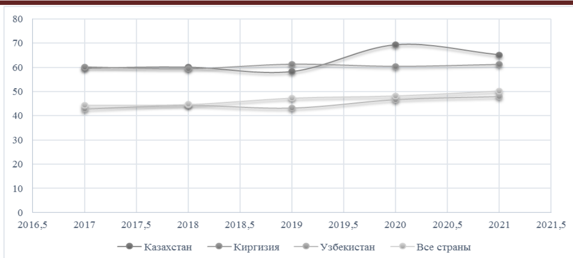
Рис. 1. Уровень экономической активности среди женщин[9], %

Согласно данным Госкомстата Республики Узбекистан, в республике экономическая активность женщин не ниже, чем в Казахстане и Киргизии, поскольку Госкомстат и Министерство занятости и трудовых отношений (МЗТО) относят всех женщин с детьми до 3 лет к экономически неактивным