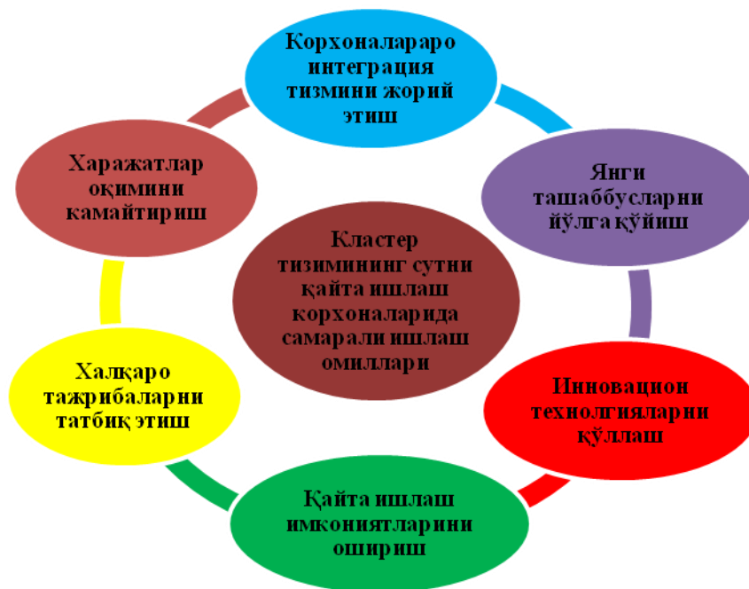
1-диаграмма. Кластер тизимининг сутни қайта ишлаш корхоналарида самарали ишлаш омиллари

кил этади. Биринчидан, корхоналараро интеграция тизимини жорий этиш бўлиб, бундан асосий мақсад корхонлар ўртасида ўзаро кластер тизими асосида яхлит ҳамкорликни ташкил этиш ҳисобланади. Яхлит ҳамкорлик иқтисодий муаммоларнинг бартараф этилишини таъминлайди. Иккинчидан, янги ташаббусларни йўлга қўйиш кластер тизимини ривожлантирувчи энг асосий омил саналади.