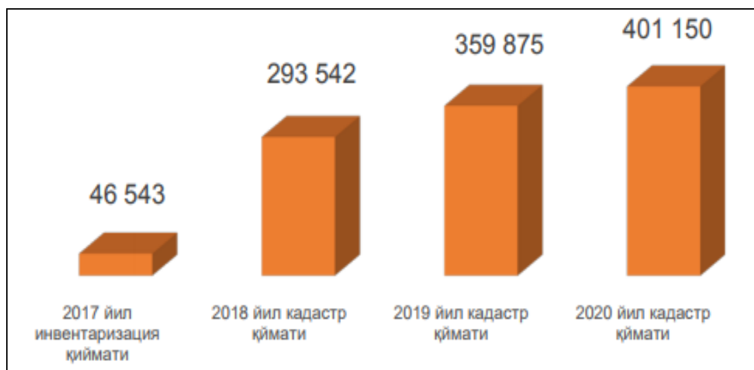
1-расм. Солиққа тортиш мақсадида мулк объектлари қиймати (млрд. сўмда),

мулкига кадастр қийматидан (2018 йилдан инвентарь қийматдан бекор қилинган) солиқ ундирилиши, ўз навбатида, солиқ тушумларининг ўсишига олиб келган. Жисмоний шахслар мол-мулкига солиқ солиш мақсадида кўчмас мулкига кадастр қиймати 46,6 трлн. сўмдан 293,6 трлн. сўмга ўсган (1-расм). Шу билан бирга, ўтган йиллар мобайнида ушбу солиқ ставкаси 8,5 бараварга камайтирилган.