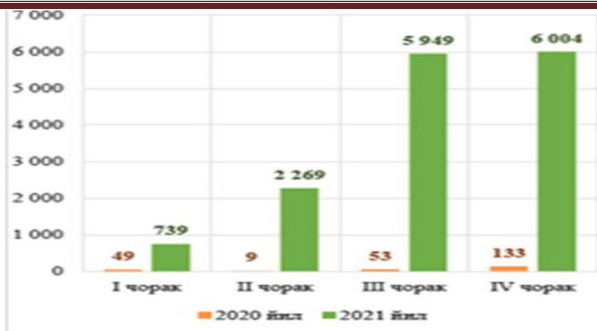
1-расм. QR-online тизимида амалга оширилган транзакциялар транзакциялар ҳажми ҳақида маълумот, млн.сўмда [14]

Умуман олганда, банк хизматлари сифати ва оммабоплигини ошириш бўйича барча банкларда масофавий банк технологияларининг, базавий банк хизматлари ҳамда замонавий тўлов хизматларининг кенг тадбиқ қилинганлиги банк хизматларидан фойдаланувчиларга кенг қулайлик ва имкониятларни яратилганлиги молиявий хизматлар ҳажмининг юқори ўсишига хизмат қилади.