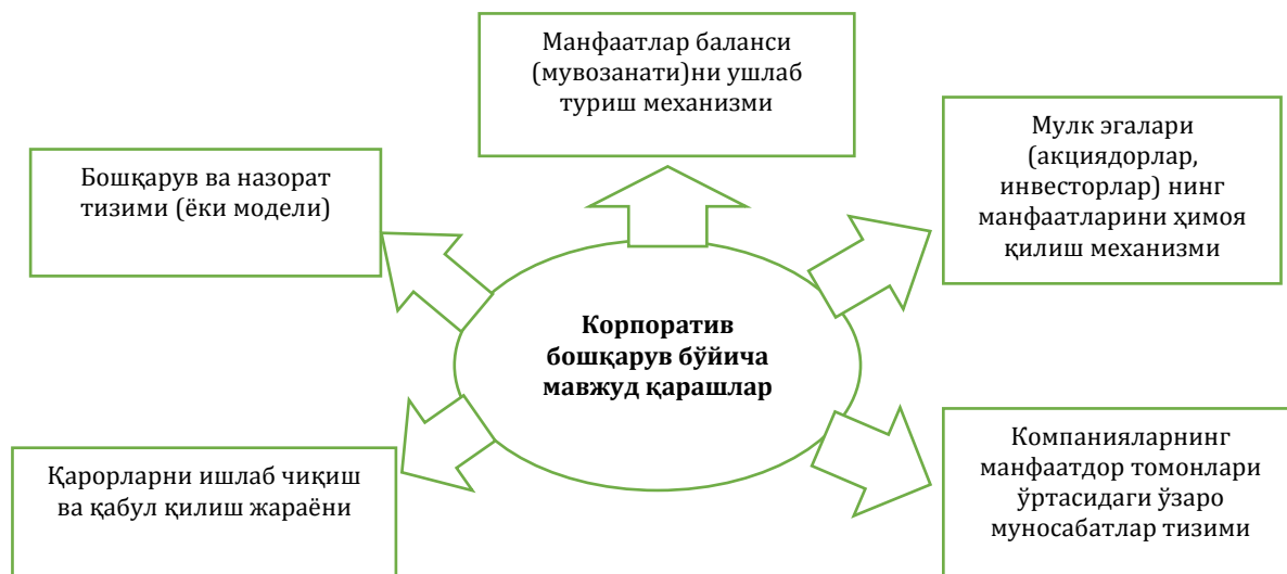
1-расм. Корпоратив бошқарув бўйича мавжуд қарашларни гуруҳлаш