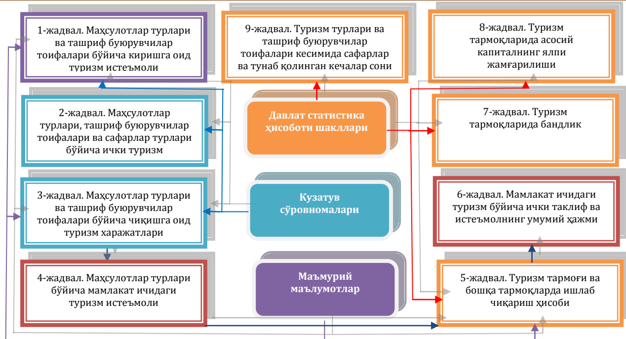
1-расм. Туризм ёрдамчи ҳисобини шакллантириш учун маълумотлар манбалари