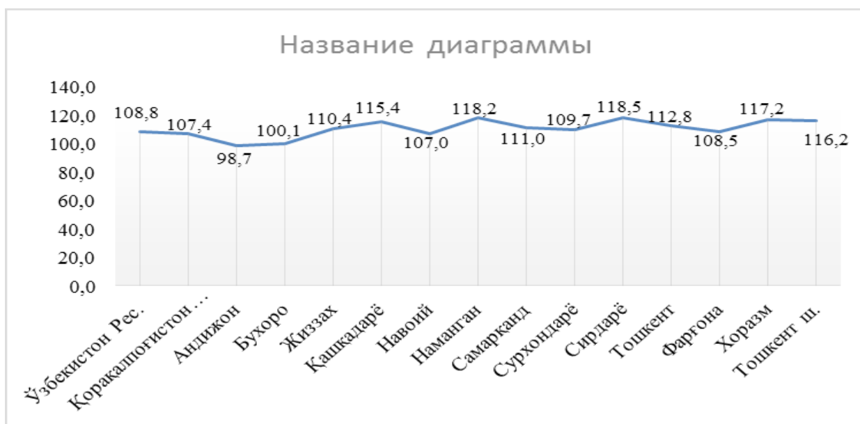
3-расм. Худудлар бўйича саноат маҳсулоти ишлаб чиқаришнинг ўсиш суръатлари (ўтган йилга нисбатан фоизда)

Худудларнинг саноат салоҳиятини ошириш чора-тадбирларининг изчил амалга оширилиши республиканинг аксарият худудларида саноат ишлаб чиқаришини мунтазам равишда ўсиши кузатилмоқда. Хусусан, 2021 йилда саноат ишлаб чиқариши ўсиш кўрсаткичлари юқори бўлган худудлар Сирдарё вилояти – 18,5 фоиз, Наманган вилояти – 18,2 фоиз ва Хоразм вилояти – 17,2 фоиз. Энг паст ўсиш кўрсаткичи Бухоро вилоятида кузатилган – 1 фоиз. Андижон вилоятидан эса саноат ишлаб чиқариши кўрсаткичида пасайиш кузатилган.