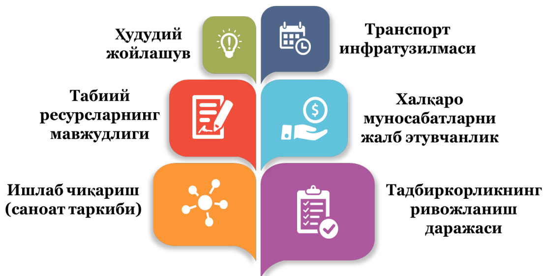
1-расм. Мамлакат ва унинг ҳудудлари иқтисодий хавфсизлигини таъминловчи омиллар 1

Юқоридаги расмдан кўриниб турибдики, мамлакат ва унинг ҳудудлари иқтисодий хавфсизлигини таъминлаш омиллари қаторида саноат ишлаб чиқариши ва унинг таркиби ҳам алоҳида ўринга эга. Демак, биз ҳудудий саноат ишлаб чиқариши ҳажми ва унинг таркиби бўйича кўрсаткичларни таҳлил қилиб, ўша ҳудуднинг иқтисодий хавфсизлик ҳолатига маълум бир маънода баҳо беришимиз мумкин.