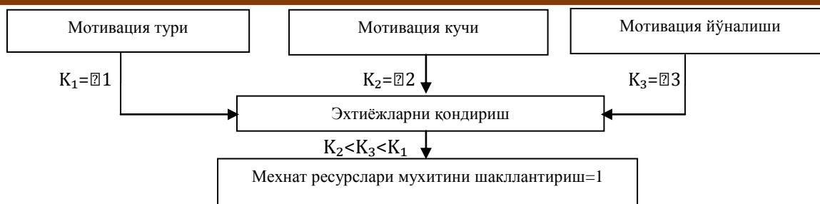
3-расм. Худудий меҳнат бозорида меҳнат ресурсларини рағбатлантириш модели