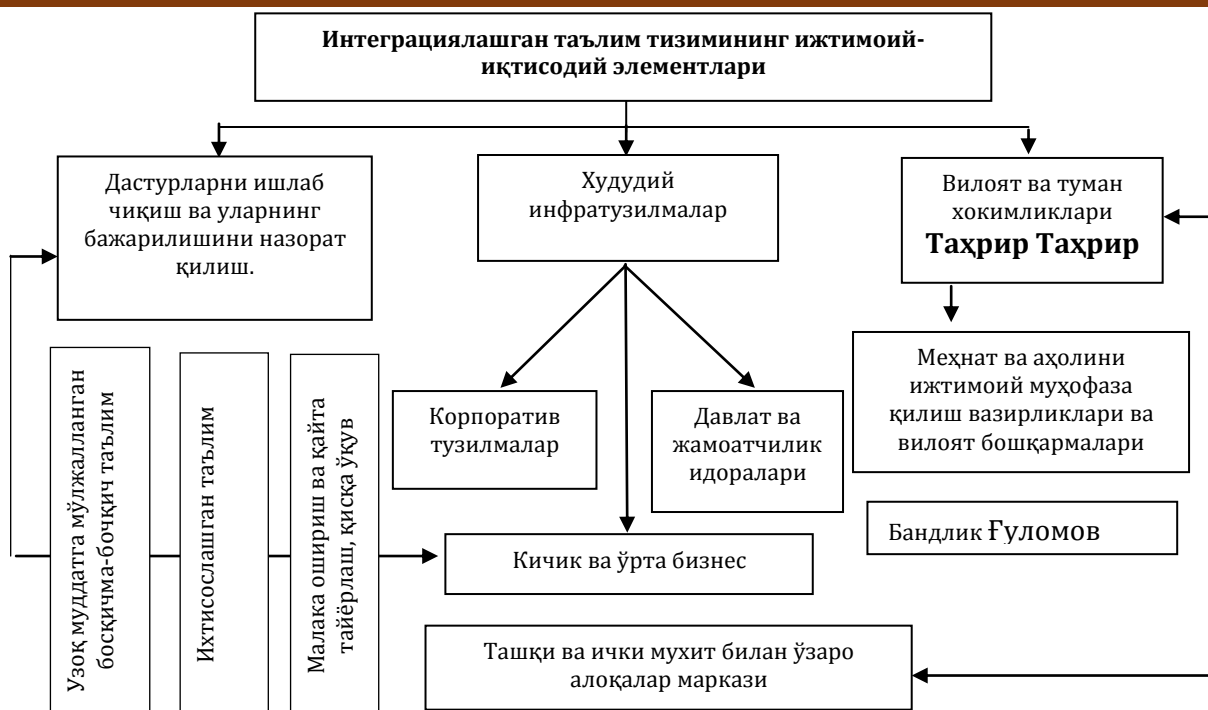
2-расм. Меҳнат бозорини кластерлаш шакли