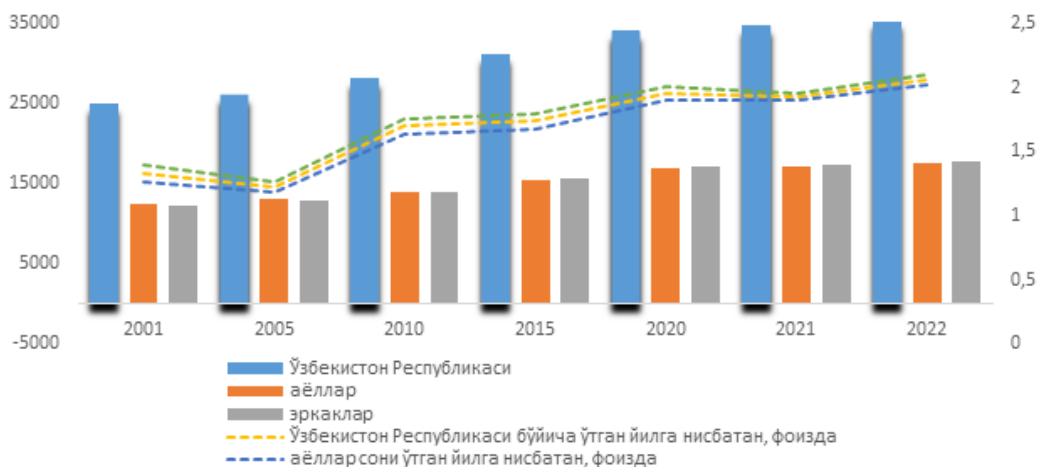
1 – диаграмма. Ўзбекистонда демографиясидаги баъзи ўзгаришлар 1

Юқорида келтирилган чизмадан кўринадик, мамлакатимизда аҳоли сони ўсишининг катта ҳиссаси 2005 ва 2010 йиллар оралиғига тўғри келади. Мазкур кўрсаткич 2010 йилдан 2022 йилгача бир маромда ўсишда давом этиб келмоқда. Аҳоли сонидан эркеклар биров устунлик қилаётган бўлишига қарамасдан, иккала жинсдагиларнинг ўсиш даражаси деярли бир хил натижани кўрсатмоқда.