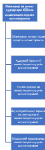
1-расм. Кўп поғонали инвестиция муҳитининг мониторингини ташкил этиш тизими

Ҳар қандай хўжалик тизимининг инвестиция муҳити доимо ижобий ёки салбий томонга, айниқса, ўтиш даври иқтисодийида ўзгариб турадиган фавқулоддаги ҳолат ҳисобланади. Шу сабабли, инвестиция муҳитининг доимий мониторингига зарурат туғилади. Яъни, бизнинг фикримизча, мамлакат ва унинг ҳудудларида мониторинг тизимини минтақалар ва тармоқлар даражасида мунтазам ўтказиб туриш мақсадга мувофиқдир. Бу эса, республика инвестиция сиёсати самарадорлигини оширишга хизмат қилади. Шуларни инобатга олиб, мамлакатда иқтисодий ислоҳотлар жараёнида шаклланган инвестиция сиёсати ва уни амалга ошириш механизмларини таҳлил қиламиз. Шунга кўра, инвестиция муҳити мониторингининг беш поғонали моделини таклиф этамиз (1-расм).