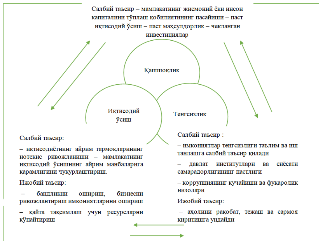
1-расм. Қашшоқлик, тенгсизлик ва иқтисодий ўсиш ўртасидаги боғлиқлик ва уларнинг ўзаро таъсири