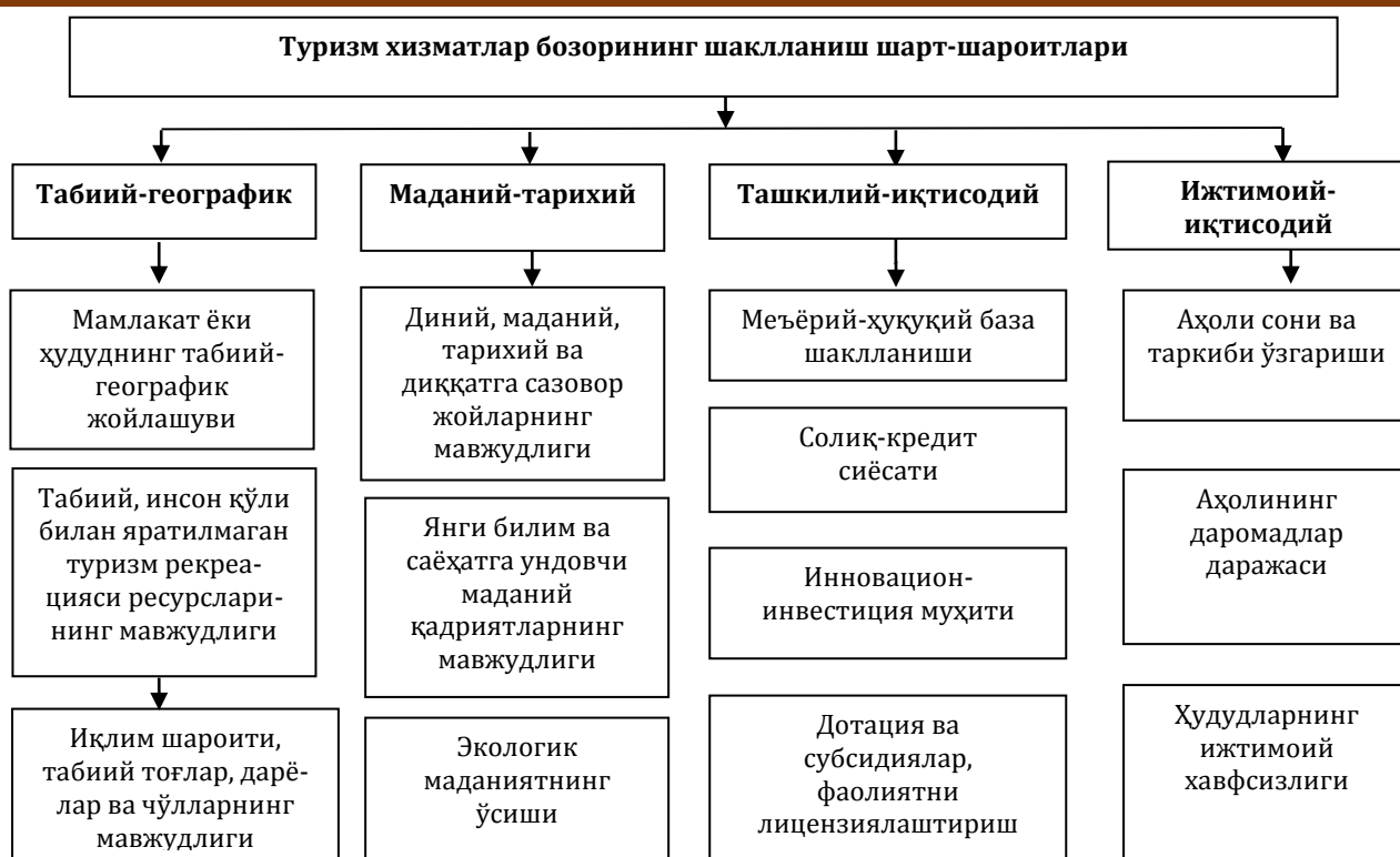
1-расм. Худудий туризмни ривожлантиришда туризм хизматлар бозорининг шаклланиш шарт-шароитлари [10]

Иқтисодий тартибга солиш усуллари асосида соҳа корхоналари ва барча манфаатдор томонлар фаолиятини туризм бозорида фаолият олиб боришга рағбатлантириш орқали (солиқ ва солиқ имтиёзлари, имтиёзли кредитлар, дотация ва субсидиялар, лойиҳавий молиялаштириш, давлат буюртмалари) амалга оширилади.