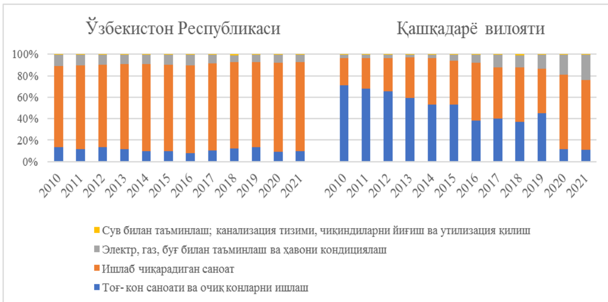
1-расм. Саноат тармоғининг таркибий ўзгариш динамикаси

либ бу тармоқнинг улуши 7,6 фоиз пунктига ўсиб, 83,0 фоизга етганини кўриш мумкин. Бу ўсиш, асосан, тоғ-кон саноати ва очиқ конларни ишлаш ҳамда электр, газ, буғ билан таъминлаш ва ҳавони кондициялаш тармоқлари улушининг камайиши ҳисобига юз берган. Сув билан таъминлаш, канализация тизими, чиқиндиларни йиғиш ва утилизация қилиш тармоғида 2010-2021 йиллар давомида жуда кичик даражадаги ўсиш юз берган (0,2 ф.п.). Қашқадарё вилояти саноат тармоғининг таркибида эса жиддий ўзгаришлар бўлганини кўриш мумкин (1-расм).