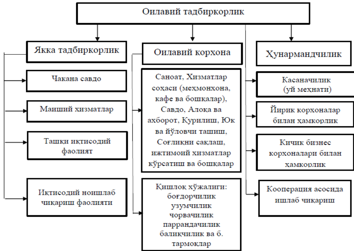
2-расм. Oilaviy tadbirkorlik faoliyati turarlari [12]

Oilaviy tadbirkorlikni moлиялаштиришда risklarнинг олдини олиш, аҳолининг тўлов қобилиятини баҳолаш мақсадида қуйидаги формула ёрдамида ҳисоблаб чиқишни таклиф этамиз. Oilaviy tadbirkorlikдан олинган даромадларнинг умумий даромадлардаги улушининг кўпайиши oilaviy фаровонликнинг ошиб боришини кўрсатади. Oilaviy tadbirkorlikдан олинган даромадларнинг умумий даромадлардаги улушини (Тдул) қуйидагича аниқлаш мумкин: