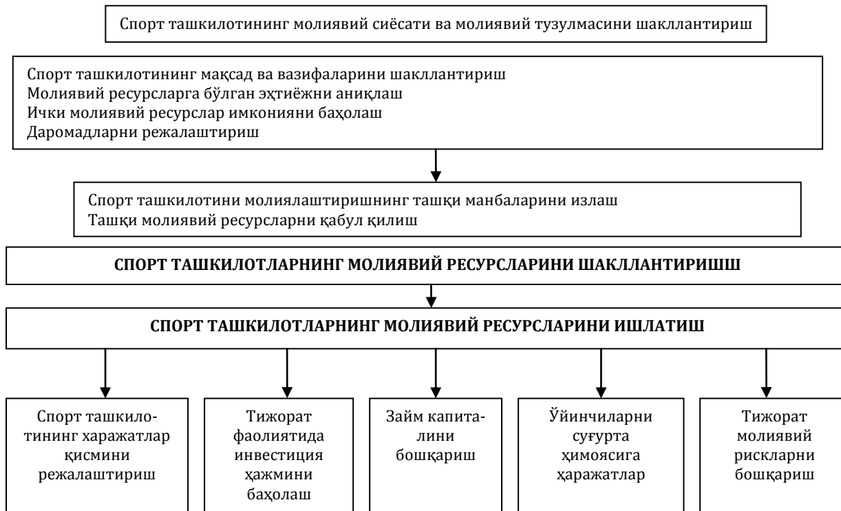
3-расм. Спорт ташкилотининг молиявий маблағларини бошқаришнинг алгоритми

тўғридан-тўғри боғлиқлигини инobatга олган ҳолда, уни молиялаштиришнинг янги манбааларини аниқлаш, мавжудларини такомиллаштириш талаб этилади, шу билан бирга, соҳада шаклланган молиявий муносабатларни доимий назорат қилиш ва тартибга солиш харажатларни оптималлаштириш, мақбул даромад манбааларини аниқлаш ҳамда энг муҳими яширин ҳавфларни бартараф этиш имкониятини беради. Ушбу жиҳатдан спорт ташкилотининг молиявий маблағларини бошқаришнинг алгоритмини ишлаб чиқиши мақсадга мувофиқдир (3-расм).