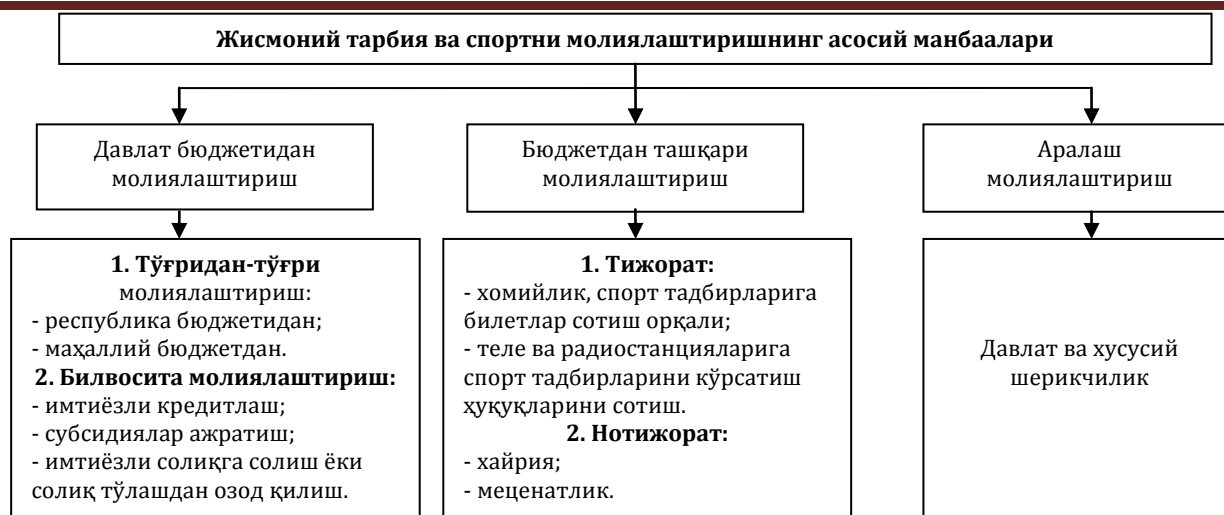
1-расм. Жисмоний тарбия ва спортни молиялаштиришнинг асосий манбаалари