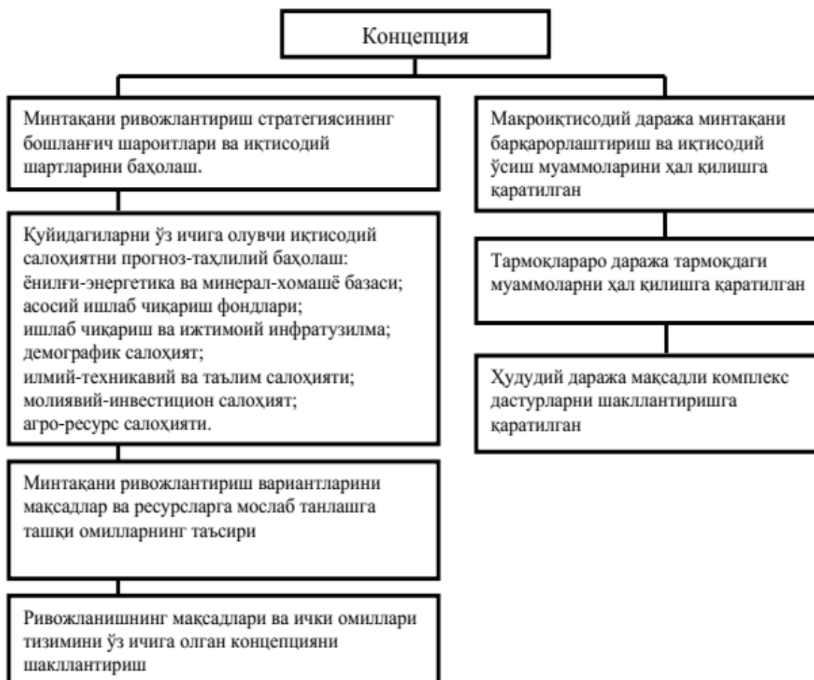
1-расм. Минтақавий прогнозлаш стратегияси концепцияси тузилмаси

дастурлар, мақсадли комплекс ҳужжатлар ишлаб чиқилади, уларда батафсил ва аниқ асосланган жиҳатлар, шунингдек, муаммоли масалаларнинг мувофиқлаштириши концепция даражасига кўтарилади. Концепция шакли тўртта блок ва учта тенг даражали жиҳатлардан иборат (1-расм).