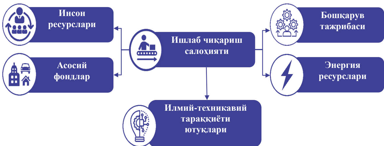
1-расм. Ишлаб чиқариш салоҳиятининг схематик тусилиши

Корхонанинг ишлаб чиқариш салоҳиятини қуйидагича тасвирлаш мумкин (1-расм):