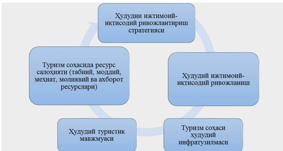
2-расм. Туризм соҳасида ресурс салоҳиятининг ҳудудий ижтимоий-иқтисодий ривожлантириш стратегияси билан ўзаро боғлиқлиги [15]

учун муносиб турмуш даражасини сақлаш ва тўлов балансини яхшилаш учун шароит яратишга имкон берадиган туризм соҳасидаги фаолиятни ривожлантириш муҳим аҳамият касб этади.