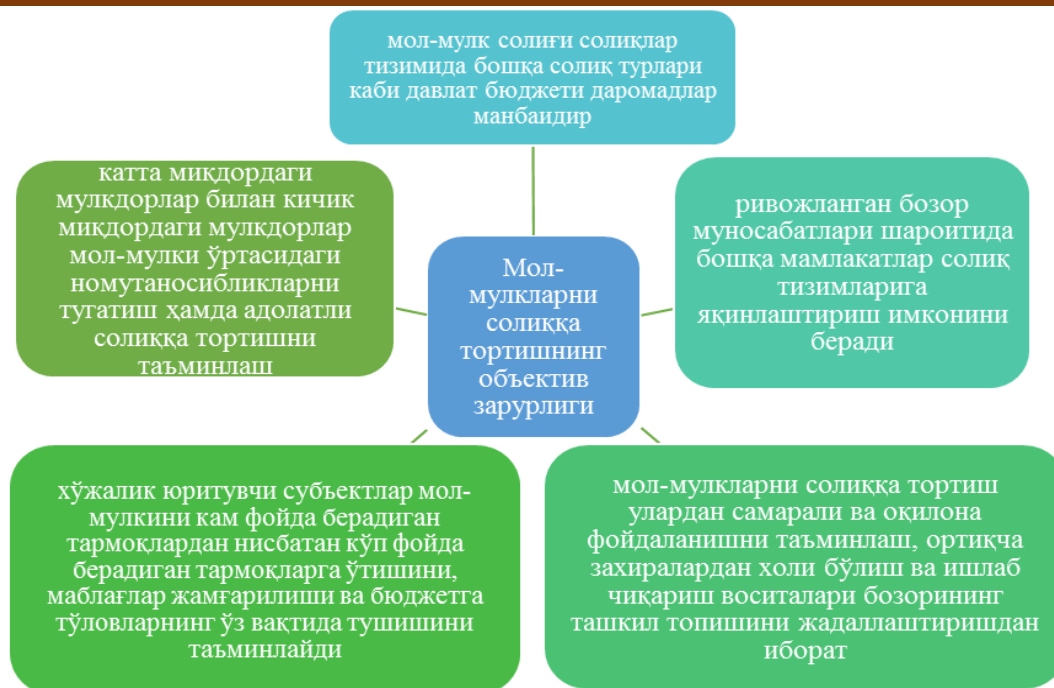
2-расм. Мол-мулкларни солиққа тортишнинг объектив зарурлиги

Давлат хусусий мулкни солиққа тортиш йўли билан хўжалик юритувчи субъектлар ҳамда фуқаролар мулкларини қонунийлиги ва унинг ҳаракатини назорат қилиб боради.