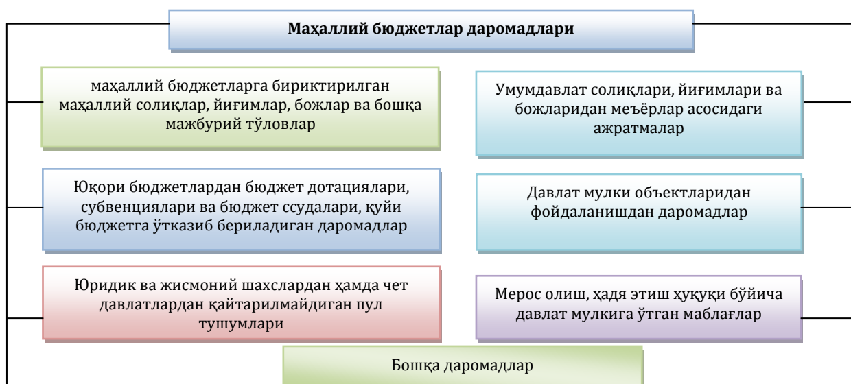
1-расм. Маҳаллий бюджетлар даромадлари

Ушбу мақсадга эришишда, аввало, маҳаллий ўз-ўзини бошқариш органларига кўпроқ мустақиллик бериш, маҳаллий бюджетнинг даромадлар манбалари ва харажатларнинг аниқ мақсадли ҳамда асосли йўналишини белгилаш, бюджетдан молиялаштириладиган ташкилот (муассаса)ларнинг харажат сметалари оқилона тузилишини таъминлаш, ўз навбатида, бюджетга солиқ тушумлари тушишини назорат қилиш ва шу кабиларни ўз ичига олади.