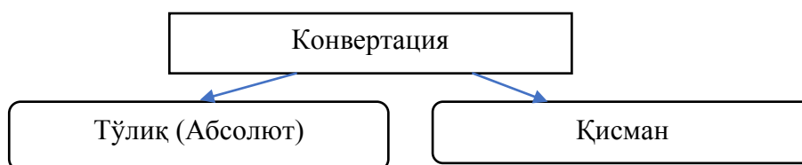
1-расм. Конвертация турлари

Бугунги кунда санаб ўтилган пул бирликлари жаҳон иқтисодиётида жиддий ўрин эгаллаган. Валюта конвертациясининг белгилари ва шартлари ўзгаришсиз қолганда, ўзининг асосий хусусиятларини сақлаб қолган валюта конвертациясининг икки тури мавжуд: тўлиқ ва қисман (турли шартлар билан) (1-расм).