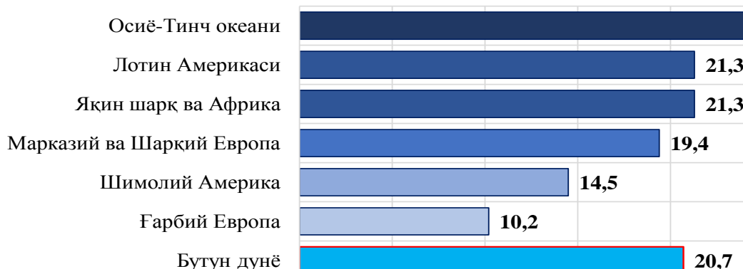
2-диаграмма. Электрон тижорат кўрсаткичлари, минтақалар кесимида (2019 йил, %)