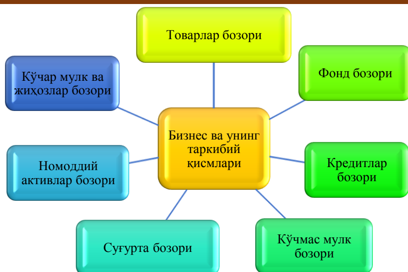
1-расм. Бизнес ва унинг таркибий қисмларининг турли бозорларда иштироки[12]

Бизнес қийматини баҳолаш жараёнида учта асосий жиҳатга алоҳида эътибор қаратиш мўҳим ҳисобланади. Булар: