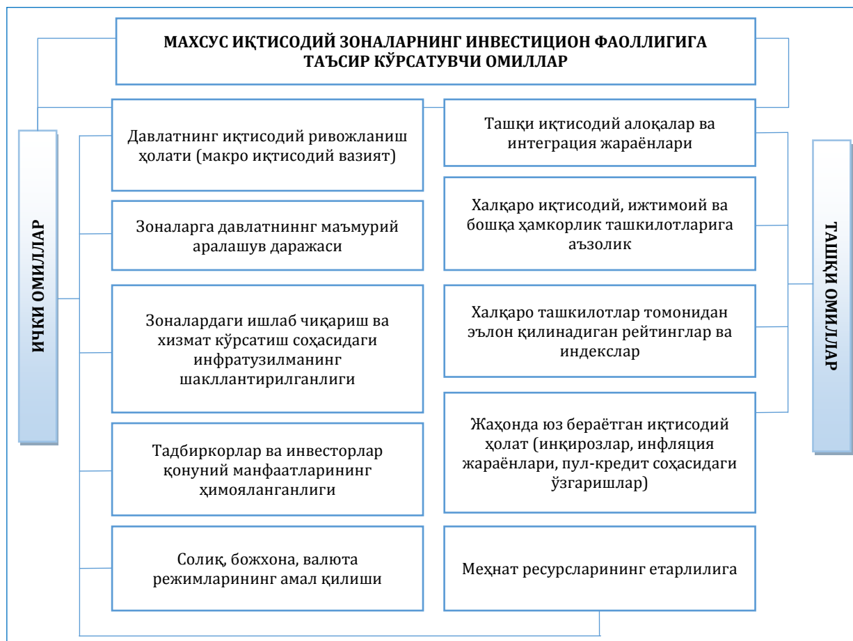
2-расм. Махсус иқтисодий зоналардаги инвестиция оқимига таъсир кўрсатувчи омиллар

Махсус иқтисодий зоналарга таъсир этувчи омилларни кўриб чиқиш орқали ушбу саноат зоналаридаги инвестицион фаолликни ошириш имкониятлари юзасидан илмий асосланган таклиф ва тавсияларни ишлаб чиқиш имконияти юзага келади.