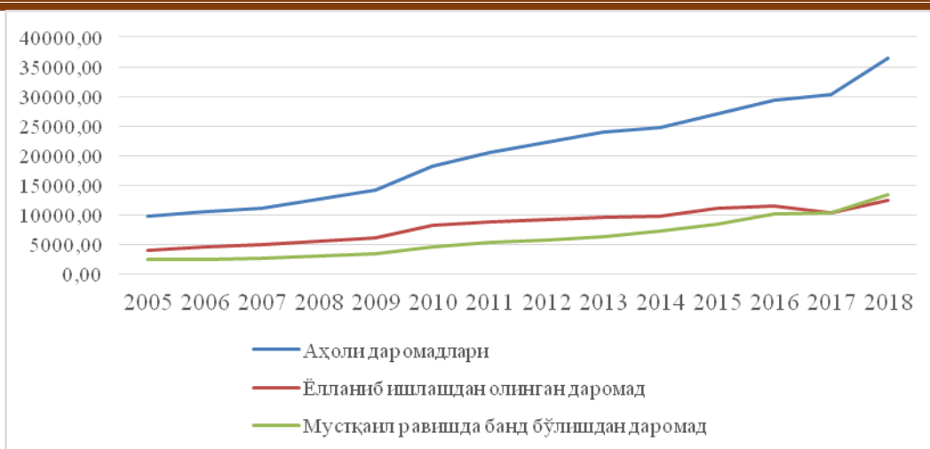
2-расм. Аҳоли даромадлари, ёлланиб ишлашдан олинган даромад ва мустақил равишда банд бўлишдан даромад (млрд. сўмда 2005-йил баҳоларида)[6]

Чунки F-статистиканинг P-қиймати жудаям кичик (0.0001). Агар муҳимлик даражаси 1% деб олинган тақдирда ҳам, регрессия тенгламасидаги омил белгиларнинг натижавий белгига таъсир статистик жиҳатдан аҳамиятли. 3-жадвалдаги маълумотларга таяниб