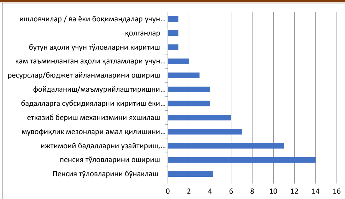
2-расм. Мамлакатлар бўйича пенсия тизими доирасида аҳолини қўллаб-қувватлаш чоралари, мамлакатлар сони[22]

Ўртача ривожланиш даражасига эга бўлган айрим мамлакатлар пенсия тўловлари, қўшимча индексациялар (масалан, Албания, Болгария, Туркия, Миср) ёки пенсионерларга ягона вақтдаги тўловлар (Аргентина) ҳақида қарор қабул қилдилар. Суғуртали пенсия тизимлари мавжуд бўлмаган кам тараққий этган мамлакатлар ижтимоий пенсиялардан фойдаланишни кенгайтириш ҳақида қарор қабул қилдилар ёки умуман, шундай ижтимоий дастурларни киритдилар (Самоа, Гвинея-Бисау ва б.) [22].