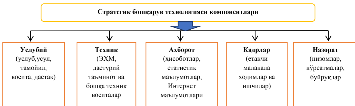
1-расм. Стратегик бошқарув технологияси компонентлари

Бошқариш технологияси - бу ҳозирги даврда ва стратегик истиқболда корхонанинг олдида қўйган мақсадига эришишда бошқариш жараёнини ташкил этишдаги зарурий ресурсларнинг муқобил тақсимланишидир. Шундан келиб чиқиб, тўқимачилик корхоналарини стратегик бошқариш технологиясининг ўзига хос жиҳатлари ресурслар таъминоти ҳамда улардан фойдаланишнинг ҳолати билан изоҳланади (1-расм).