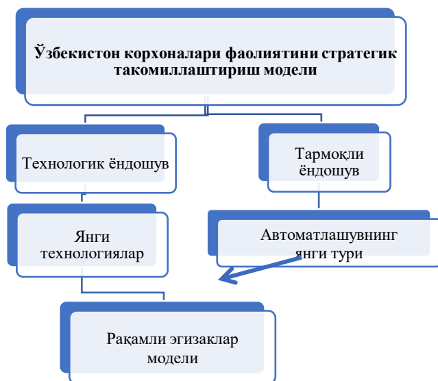
3-расм. Рақамли иқтисодиёт шароитида Ўзбекистон корхоналари фаолиятини стратегик такомиллаштиришга бўлган ёндашув

Қабул қилинган “Рақамли Ўзбекистон – 2030” стратегиясига мувофиқ, мамлакатни рақамли ривожлантиришнинг асосий йўналишларига 5 та йўналиш кўрсатилади. “Рақамли Ўзбекистон – 2030” концепциясидан келиб чиққан ҳолда, муаллиф томонидан таклиф этилаётган, Ўзбекистондаги корхоналар фаолиятини стратегик такомиллаштиришнинг “рақамли эгизаклар” моделида иккита асосий ёндашувни – технологик ва тармоқлини бирлаштиришни ўзида мужассам этган (3-расм).