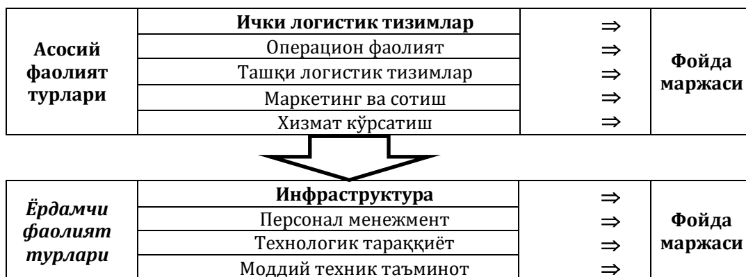
1-расм. М.Портернинг қадриятлар занжири концепцияси

Ушбу концепция харажатларни шакллантириш ва бошқаришда кенгайтирилган ёндашувга асосланади. Маълум фаолият турлари платформасидаги қадриятлар занжири бўйича харажатни шакллантирувчи механизм ҳисобга олинади. Концепциянинг хусусиятли жиҳатлари, амалдаги корхоналарни фойда олишга йўналтирилган фаолият турларини баҳолаш имкониятини беради.