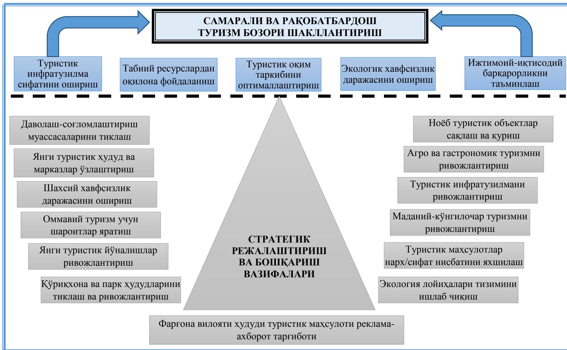
1-расм. Минтақа туристик кластерини шакллантиришда стратегик мақсадлар