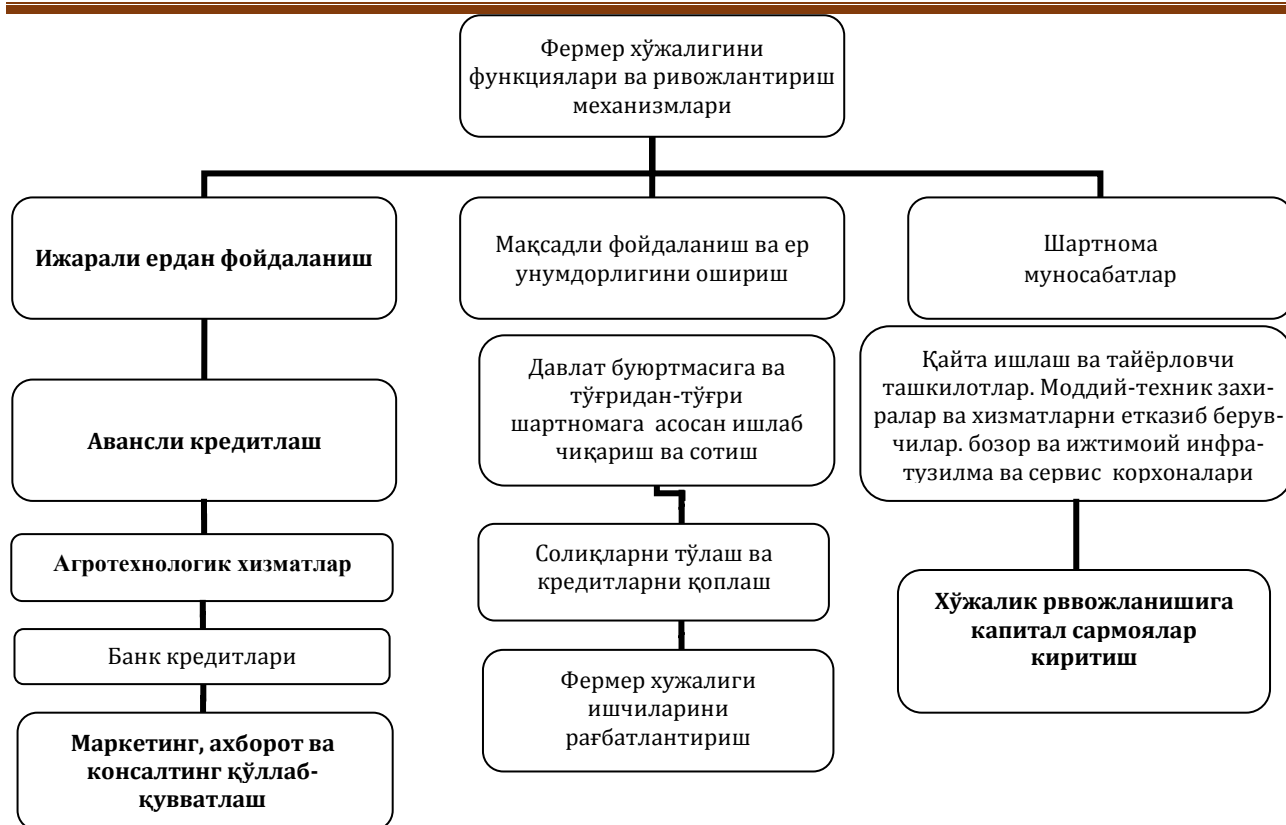
1-расм. Фермер хўжалиги фаолиятини ривожлантиришнинг асосий механизмлари[5]

Ўзбекистон Республикаси Президенти Ш.М. Мирзиёев: - “Шу билан бирга, ғалла ва мева-сабзавот кластерлари фаолиятини ҳар томонлама ривожлантириш керак. Бу соҳа биз учун нисбатан янги эканини инobatга олиб, уни давлат томонидан қўллаб-қувватлаш, жумладан, кредит тизимини соддалаштириш, харажатларни субсидиялаш, ер ажратиш билан боғлиқ тартибларни қайта кўриб чиқиш талаб этилади”[6] - деб таъкидлаб ўтдилар.