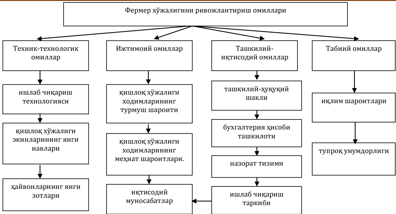
3-расм. Фермер хўжалигини ривожлантириш омиллари[9]

Мамлакат бўйича қишлоқ хўжалигидан олинадиган ялпи даромаднинг 54 фоизи деҳқончиликка ихтисослашган, 46 фоизи эса чорвачиликка ихтисослашган фермер хўжаликлари зиммасига тўғри келади. Соф фойдада бу кўрсаткич мос равишда 62 ва 38 фоизни ташкил этади. Бу сабзавот ҳамда боғдорчиликка ихтисослашган фермер хўжаликларининг ўта сердаромадлиги билан изоҳланади.