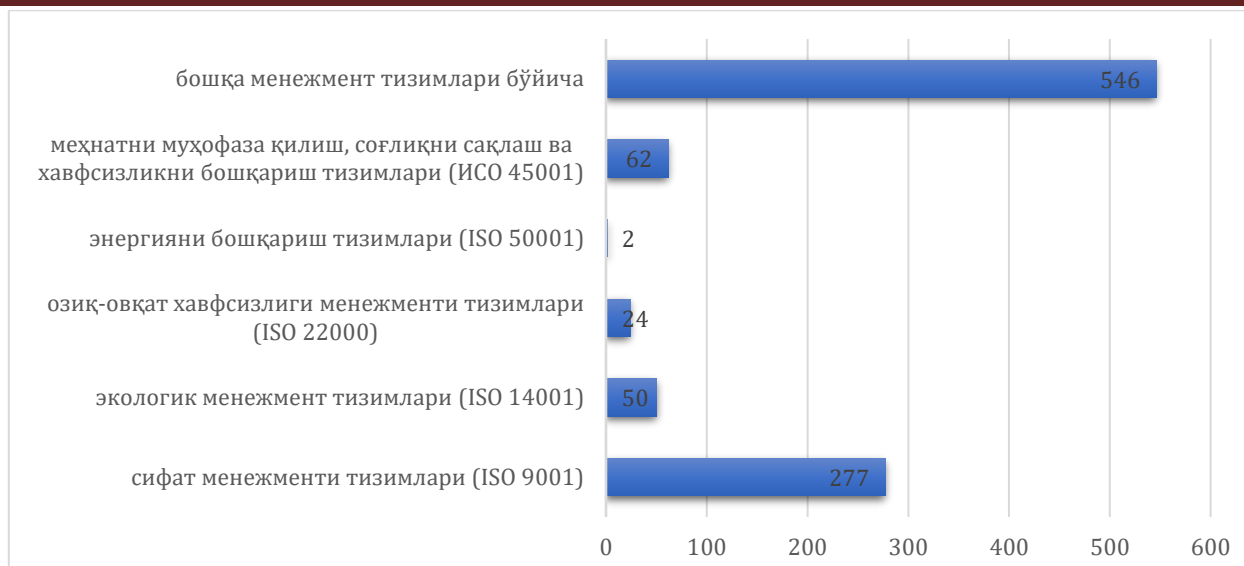
2-расм. 2023 йилда сифат менежменти тизимини жорий этиш учун тақдим этилган сертификатлар сони [8]

Шундан республикада ишлаб чиқарилган маҳсулотларга 13284 та мувофиқлик сертификати, импорт қилинадиган маҳсулотларга 116019 та сертификат берилган [8].