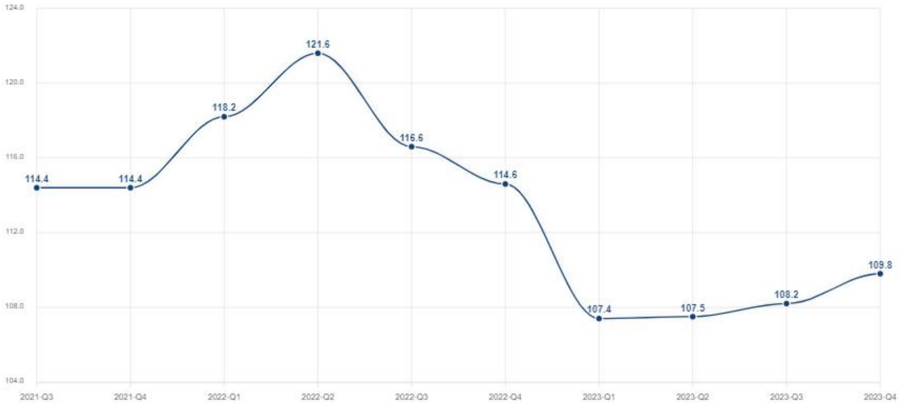
2-rasm. Sanoat mahsulotlarining deflyator indeksi (choraklik) [13]

Sanoatdagi ushbu tarkibiy o'zgarishlar quyidagi yo'nalishlarni bosqichma-bosqich amalga oshirishni talab etadi: