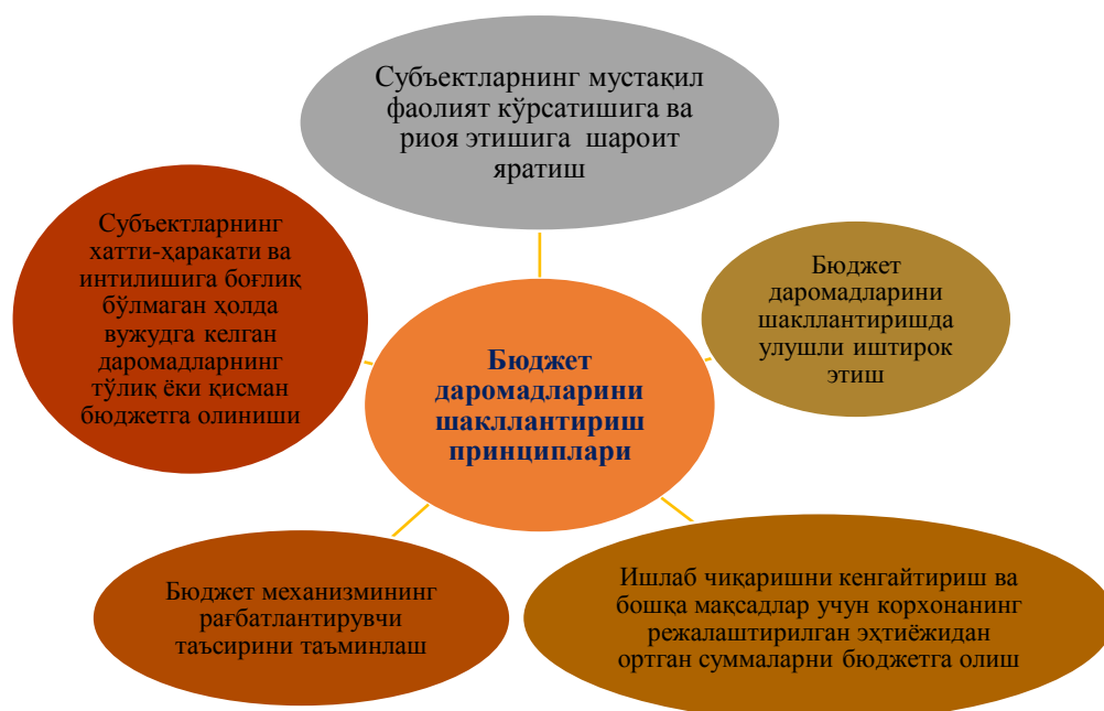
1-расм. Бюджет даромадларини шакллантириш принциплари[12]