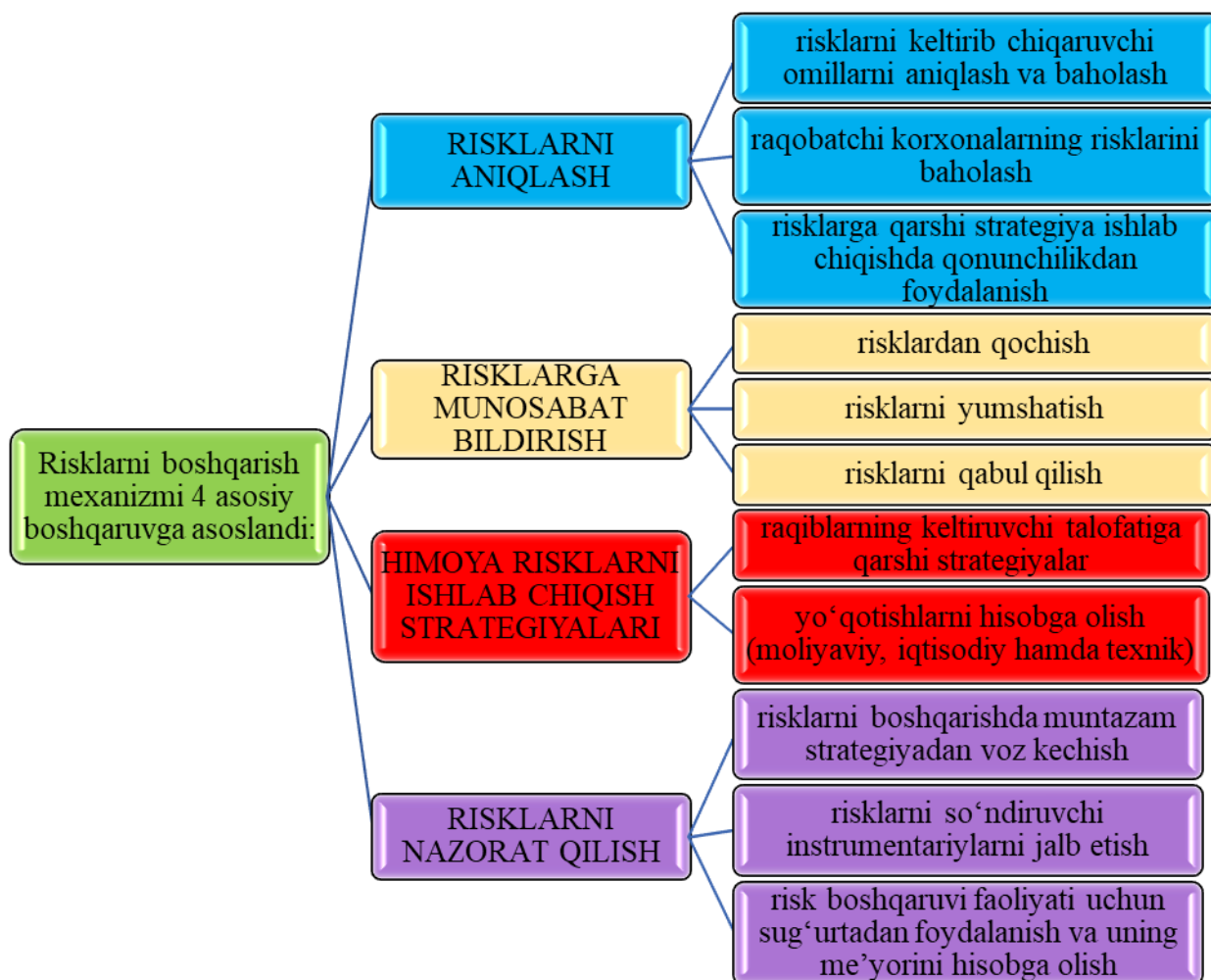
1-rasm. Risk boshqaruvi mexanizmi[9]

Risklarni baholash va uni algoritmlash XXI asrda iqtisodiyotning ilmiy va amaliy ahamiyatini ifodalovchi dolzarb masalalardan biriga aylandi. Risklarni so'ndirishni tadqiq etishda nafaqat iqtisodchi olimlar, balki matematiklar, moliya hisobi mutaxassislari, axborot texnologiyalari mutaxassislari, shuningdek, texnik fanlar vakillari ham jalb etilishi har bir yirik korxonalarining o'ziga xos strategiyasini vujudga keltirishga xizmat qildi.