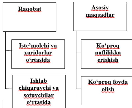
1-rasm. Raqobat ishtirokchilarining asosiy maqsadlari [14]

di. Qo'shimcha daromad keltiradigan yuqori qo'shimcha qiymatga ega bo'lgan ishlab chiqarish faoliyati rivojlangan taqdirdagina ish bilan bandlik masalalarini hal qilish mumkin.