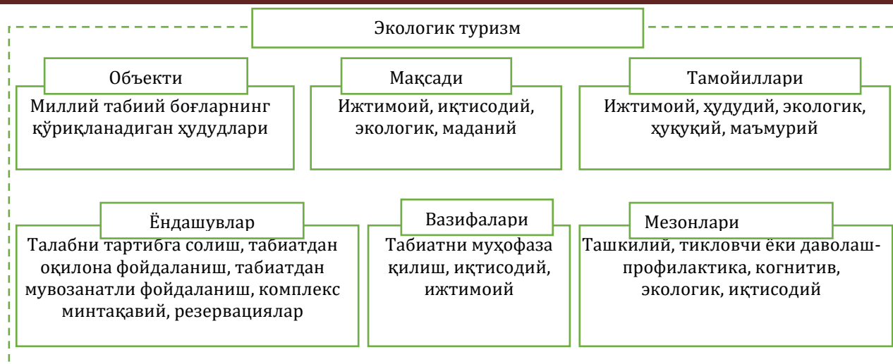
1-расм. Экологик туризмнинг моҳиятини белгиловчи компонентлар

Манба: тадқиқотчининг муаллифлик ишланмаси.