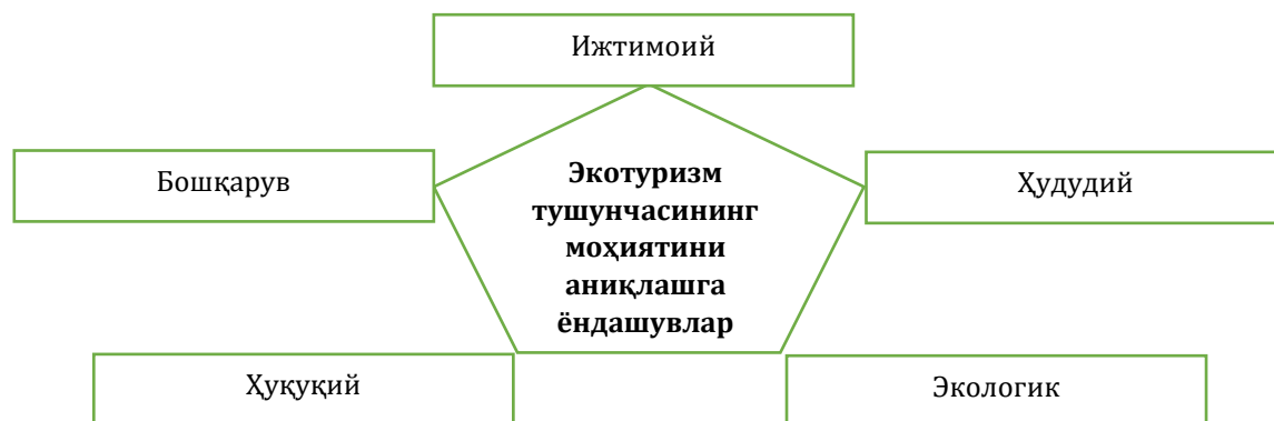
2-расм. “Экологик туризм” тушунчасининг моҳиятини аниқлашга ёндашувлар

Экологик туризм бизнес ёки саноат сифатида энди масъулиятли бизнес амалиётлари рукнига кирди ва масъулиятли туризм сифатида белгиланди. Миллий табиий боғлар ҳудудидан рекреацион ва туристик фойдаланишнинг кўп қиррали хусусиятини тушуниш кўп жиҳатдан уларнинг қиймати даражасини акс эттиради, уларнинг инсон ижтимоий онгини шакллантиришдаги, миллий ва минтақавий иқтисодиётни ривожлантиришдаги ролини белгилайди, ҳар томонлама шакллантириш имконини беради. Биз экологик туризмнинг мақсадлари, уларни маълум ёндашувларга кўра шакллантираемиз, уни ижтимоий, ҳудудий, экологик, ҳуқуқий, бошқарув ва иқтисодий нуқтаи назардан изоҳлаймиз (2-расм).