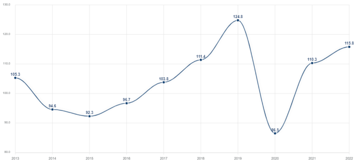
1-rasm. Eksportning o'sish sur'ati [11]

ko'rsatkichi 2019-yilga nisbatan 38,3 %ga tushgan, 2021-yilda 2020-yilga nisbatan 23,8 %ga o'sgan va hozirga kelib ko'rsatkich 115,8 %ni tashkil etmoqda (1-rasm).