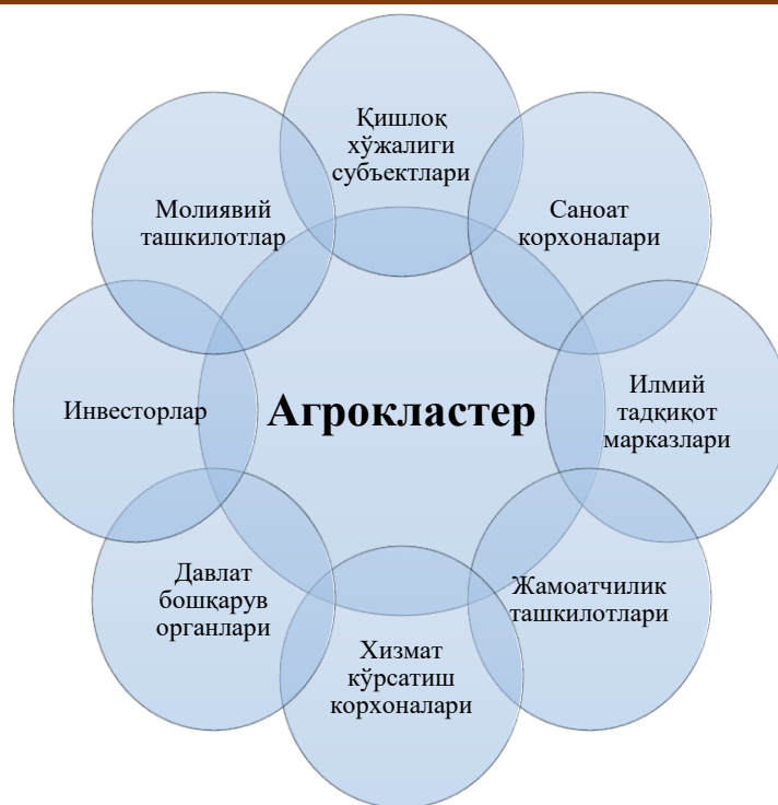
2-расм. Қишлоқ хўжалигида замонавий агрокластерларнинг таркибий тузилиши