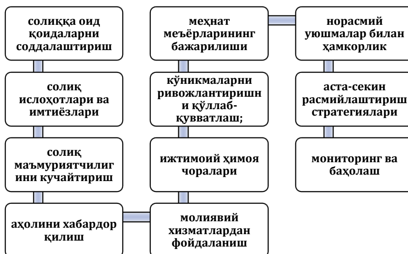
2-расм. Ўзбекистонда норасмий иқтисодиёт ҳажмини камайтиришга ёрдам берадиган тавсиялар

Умуман айтганда, Ўзбекистонда норасмий иқтисодиёт муҳим роль ўйнасада, ҳукумат солиқ тизимини ислоҳ қилиш ва расмий секторга кўпроқ субъектларни жалб қилиш чораларини кўрмоқда. Норасмий иқтисодиётга барҳам бериш мураккаб ва узоқ муддатли иш бўлиб, сиёсий чора-тадбирлар, институционал ислоҳотлар ва мақсадли стратегияларни уйғунлаштиришни талаб қилади. Норасмий иқтисодиётни бутунлай йўқ қилиш қийин бўлиши мумкин бўлсада, бу чоралар унинг ҳажмини камайтиришга ёрдам беради ва Ўзбекистонда бизнес ва ишчиларни расмий секторга ўтишга ундайди.